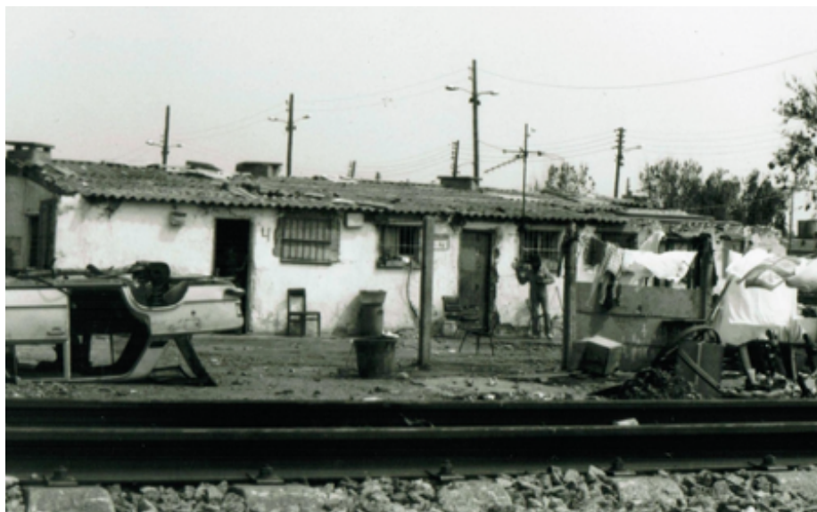
Barraques al costat de la via del tren del Camp de la Bota.

“Després de molts anys a les barraques em van donar el meu pis a La Mina i vaig entrar la primera, jo vaig estrenar el bloc. Quan vaig venir no hi havia ni aigua, ni llum, ni gas als pisos, però com estàvem desitjant sortir de la barraca vam anar corrents al pis quan ens van donar la clau. Després de posar els papers en ordre ja em van posar la meva aigua, llum i gas”