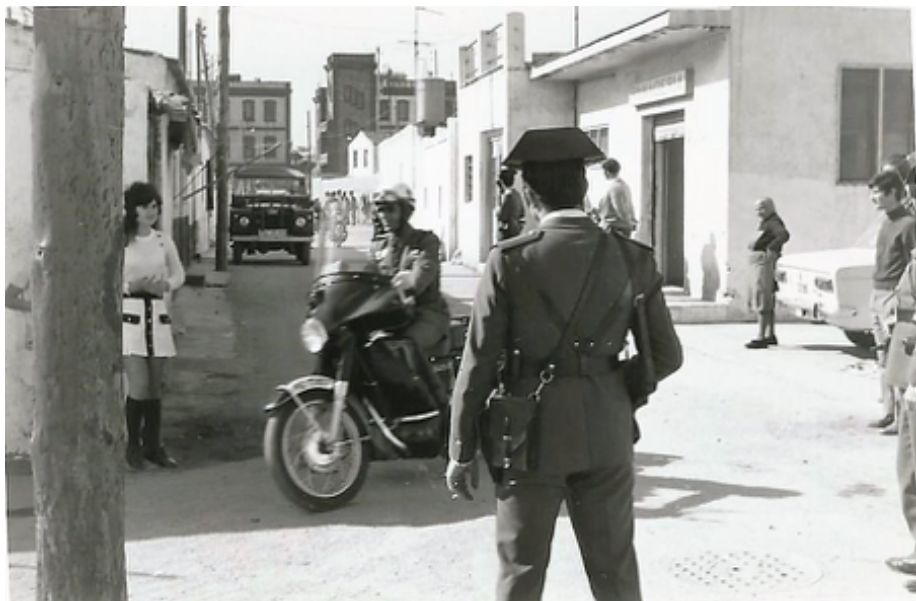
Gran batuda al Camp de la Bota.

“Ella havia d’anar a treballar fent cistelles, i havia de deixar la meva mare en un convent, la ficava de dia i la recollia de nit, perquè la nena no passés fatigues. I aquesta dona va passar molt fins que va morir... aquesta vida és millor no recordar-la.”