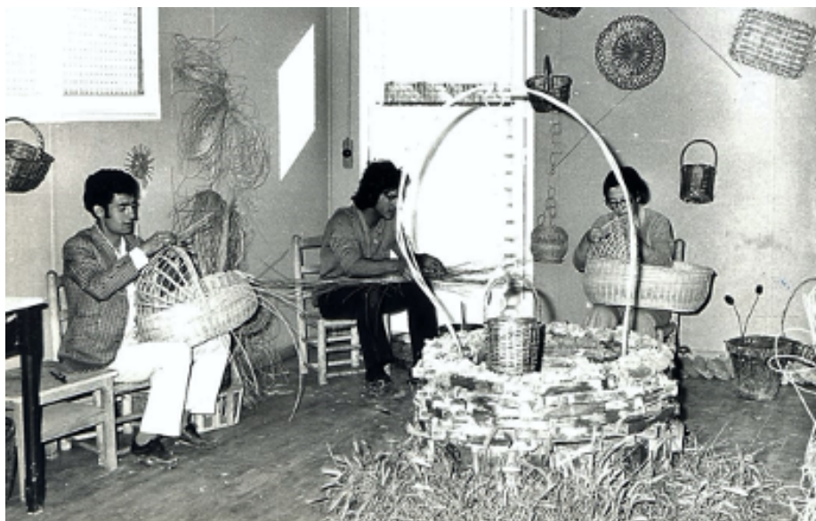
Escola d'Artesania Gitana del Camp de la Bota, "El parapet". Arxiu Històric del Camp de la Bota i la Mina. Josep Maria Monferrer Celades

"En un poble hi havia un riu on es criava el vímet, aleshores abans d'arribar-hi passàvem i el recollíem i una altra vegada tornada a començar. Així fins que vam venir a Amposta, un cop aquí els meus pares es van establir aquí, ja vam viure al pati, que deien abans..."