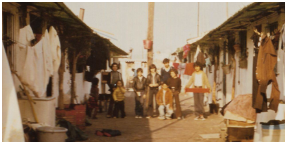
Carrer de 100 habitatges, Arxiu Històric del Camp de la Bota i La Mina. Josep Maria Monferrer Celades

“Feien de tot, el meu germà treballava fent persianes, un altre fent tanques. Catalunya és el que és perquè els de fora ho ha aixecat, cadascú ha aportat el seu gra de sorra.”